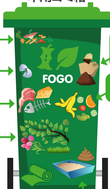
食糧および草 木用ゴミ箱